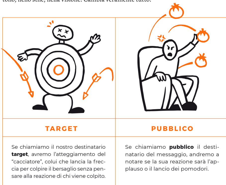
↑ Figura 1.2 Schema da target a pubblico – interpretazione dell'autore.

tando un progetto al successo. La prospettiva è diversa così come lo sono le parole e l'approccio di un metodo, che cambia sin dall'inizio. Sarà determinante concentrarsi non solo su cosa si vuole essere, ma su come potrà reagire il pubblico di riferimento. Solo così si scriveranno progetti, brief, idee creative e messaggi veramente diversi nel tono, nello stile, nella visione. Cambia veramente tutto.