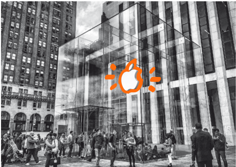
↑ Figura 1.5 Apple Store, Fifth Avenue, New York, inaugurato da Steve Jobs nel 2006.