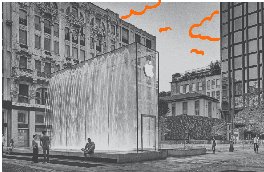
↑ Figura 1.7 L'Apple Store di Milano inaugurato nel 2018. Anche se fa parte della nuova generazione di Apple Store, rispetto a quelli descritti da Ewan Spence e riproposti nelle loro caratteristiche in Figura 1.6 è interessante vedere come la capacità di emozionare rimanga il fulcro di ogni negozio Apple.

design e persino tecniche per schizzi architettonici. “In una città così ricca di storia dell’arte, spettacolo e creatività”, ha dichiarato Angela Ahrendts, Senior Vice President di Apple Retail, “è un onore creare uno spazio dove chiunque possa essere ispirato a imparare ed entrare in contatto con le persone che vivono intorno”.